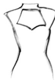
Mao et col

Couvrant pour un élégance toute en pureté